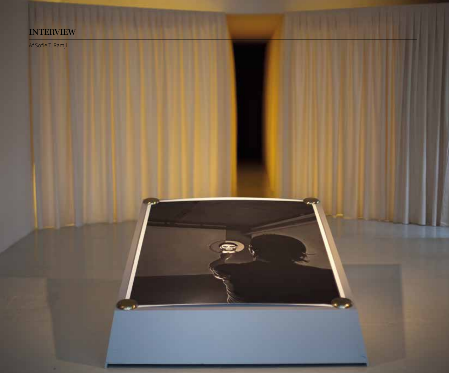
Michael Würtz Overbeck, Parable of Love, installationsview, 2016.