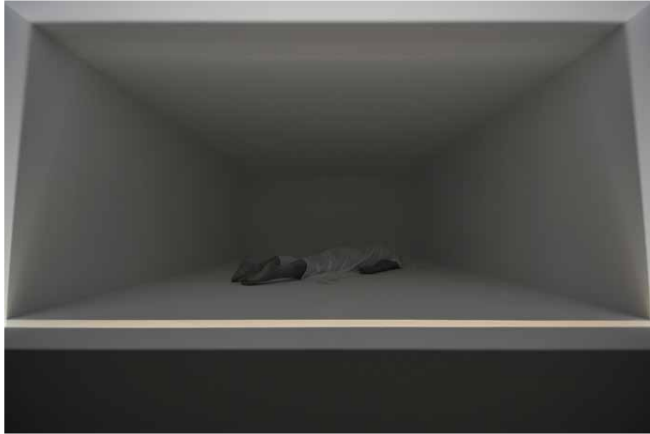
Michael Würtz Overbeck, The Reminiscences of What Once Was, Phantom Room, 2016.